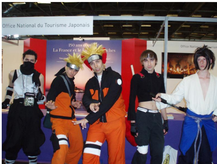
【昨年のVJCブースを訪れた来場者】